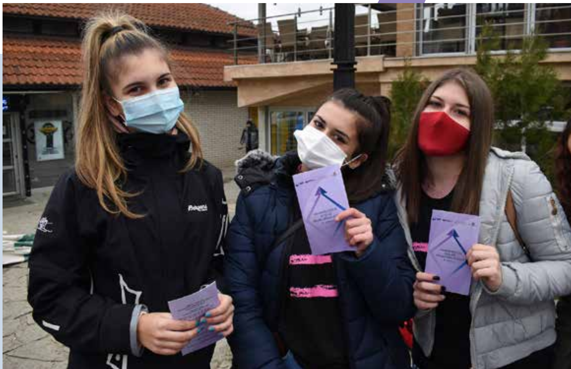
Unapređenje rodne ravnopravnosti

Projekat realizuju Fondacija Ana i Vlade Divac i Fondacija Centar za demokratiju pod pokroviteljstvom Balkanskog fonda za demokratiju i Ambasade Kraljevine Norveške. Projekat je usmeren na povećanje svesti i znanja o Poglavlju 23 i procesu daljeg usklađivanja sa pravnom tekovinom EU o položaju žena u Srbiji i radnim pravima u cilju postizanja rodne ravnopravnosti.