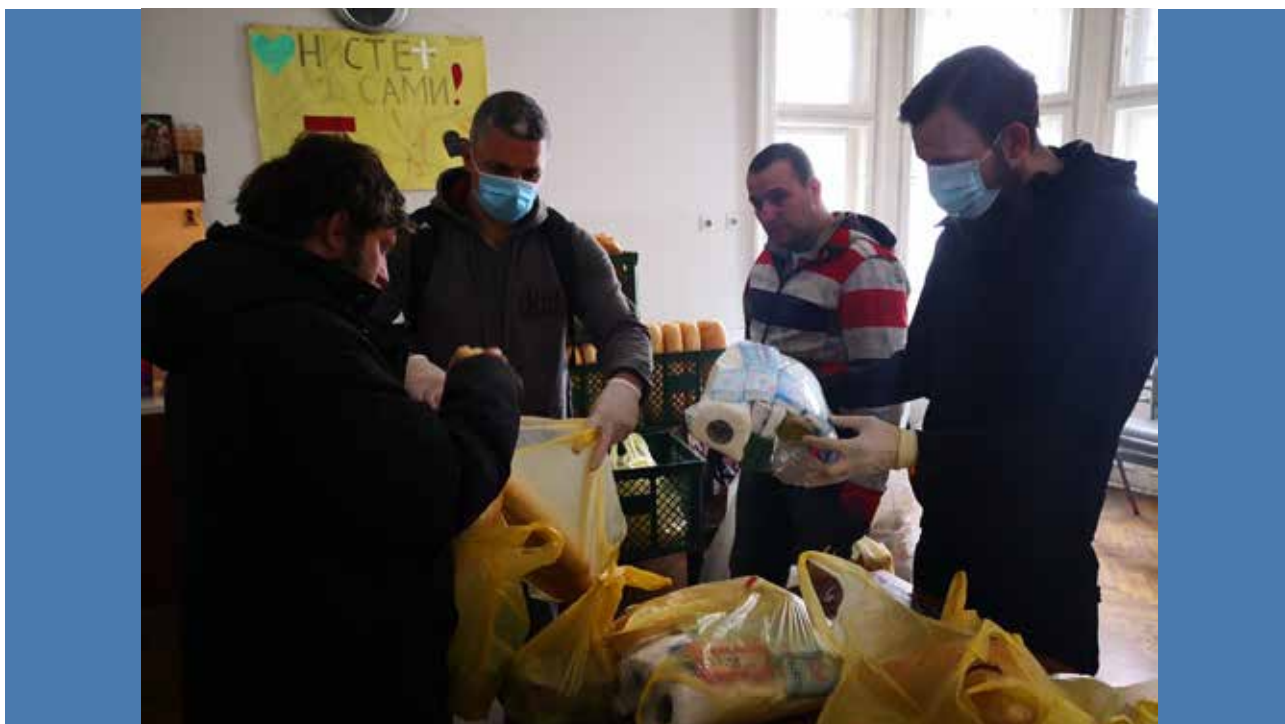
Crkvena narodna kuhinja

Odmah po proglašenju vanrednog stanja u Srbiji, fondacija je sav svoj kapacitet usmerila ka hitnom obezbeđivanju humanitarne pomoći najugroženijim građanima, lokalnim zajednicama, organizacijama civilnog društva i institucijama.