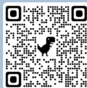
QR kod, Muzej filantropije

Tokom Festivala, posetioci su kroz 10 edukativnih videa virtuelno upoznali srpske zadužbine i zadužbinare, poput Galerije Matice srpske i Zadužbine Ilije Kolarca. Poslednjeg dana Festivala građani su bili pozivani da se uključe u humanitarne akcije birajući aktivnost koju žele da podrže i tako pojedinačno doprinesu tome da kultura davanja postane naša dobra navika. Festival je zatvoren prikazivanjem predstava za decu Kotorskog festivala pozorišta za decu „Kako rastu veliki ljudi“ i Puls teatra iz Lazarevca “Marko Kraljević i Musa Kesedžija”.