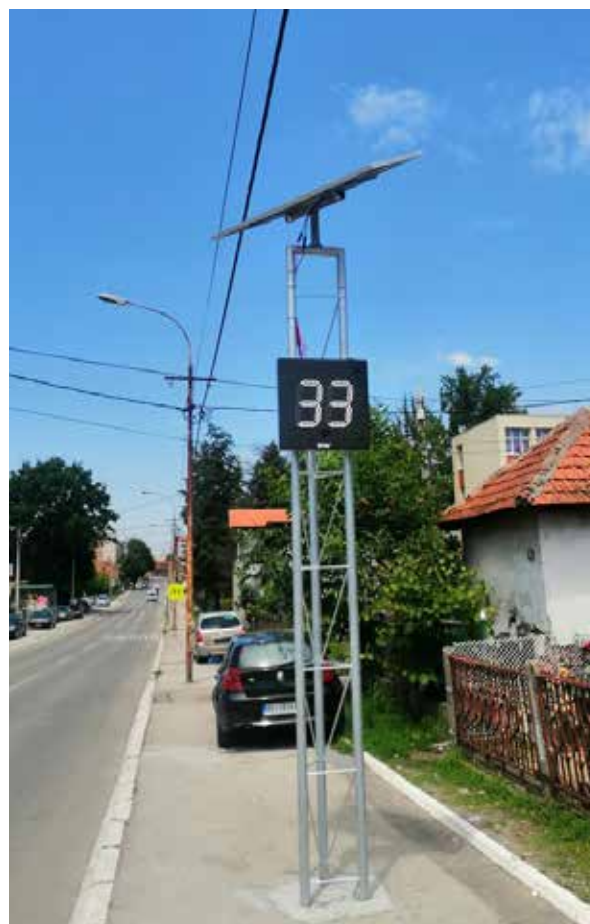
Merač brzine u Mladenovcu