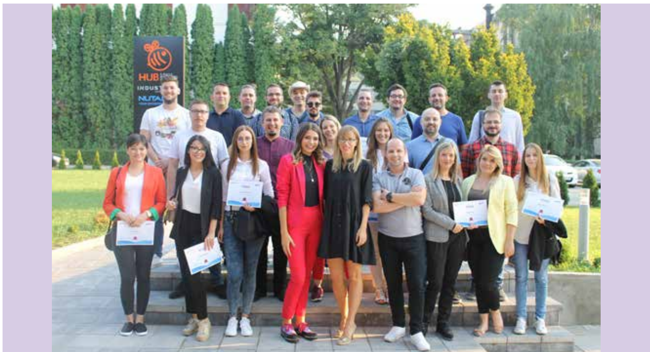
Dodela diploma uspešnim polaznicima škole IT Bootcamp

Ponosni smo na dosadašnji rad škole i radujemo se budućim generacijama. Hvala svima koji su doprineli da napravimo dobre rezultate. Nadamo se da ćete i u budućnosti biti uz nas.