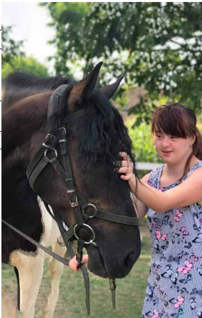
Udruženje građana Ljubitelji konja Zapadna Bačka iz Sombora, radionica

U decembru 2020. je organizovan online Festival solidarnosti na kome su učestvovalе sve organizacije sa projekta, lokalna udruženja i zainteresovano stanovništvo. U okviru Festivala dodatno MNRO iz Šida je imalo ekološku radionicu sa svojim korisnicima, Crveni Krst iz Sombora je organizovao pokaznu vežbu prve pomoći, a podeljene su i pamučne maske i materijali učesnicima Festivala.