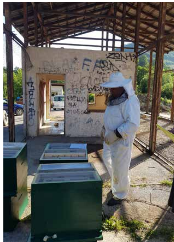
Užice, preuzimanje košnica sa pčelicama