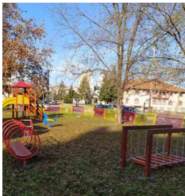
Vrtić u Smederevskoj Palanci

Kako bi se deci obezbedili bolji uslovi za igru i bezbedan boravak na otvorenom, svaki vrtić je dobio opremu za igralište koja im je bila najpotrebnija.