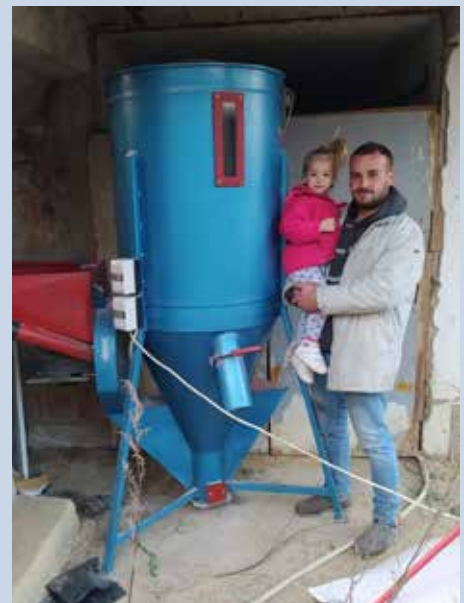
Porodica Šarković, Vidanje kod Kline, dobili mešaonu za stočnu hranu