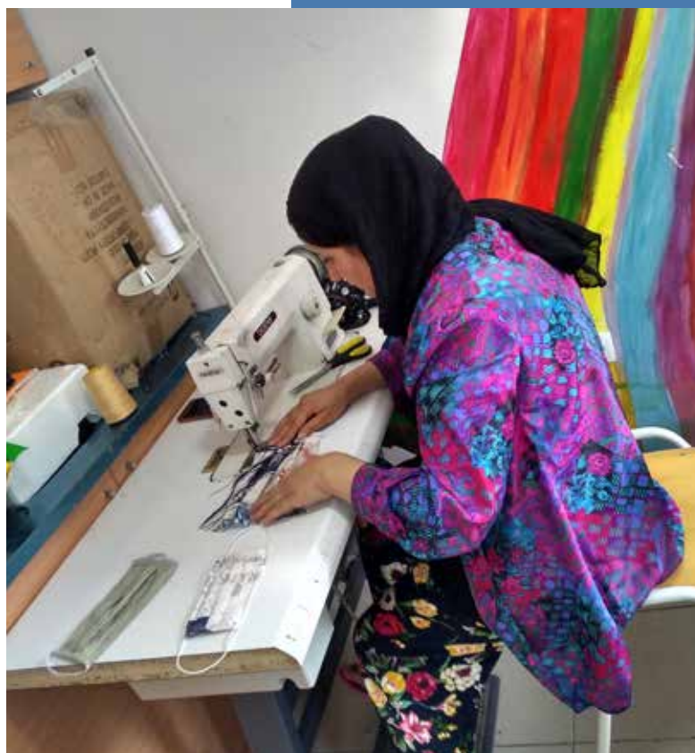
Prihvatni centar Krnjača, izrada maski za korisnike centra i za različita udruženja i za njihove korisnike

Projekat je organizovan uz podršku Fondacija za otvoreno društvo (Open Society Foundations).