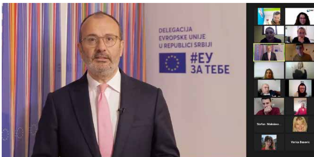
Nj.E. Sem Fabrici, Ambasador i šef Delegacije Evropske unije u Republici Srbiji