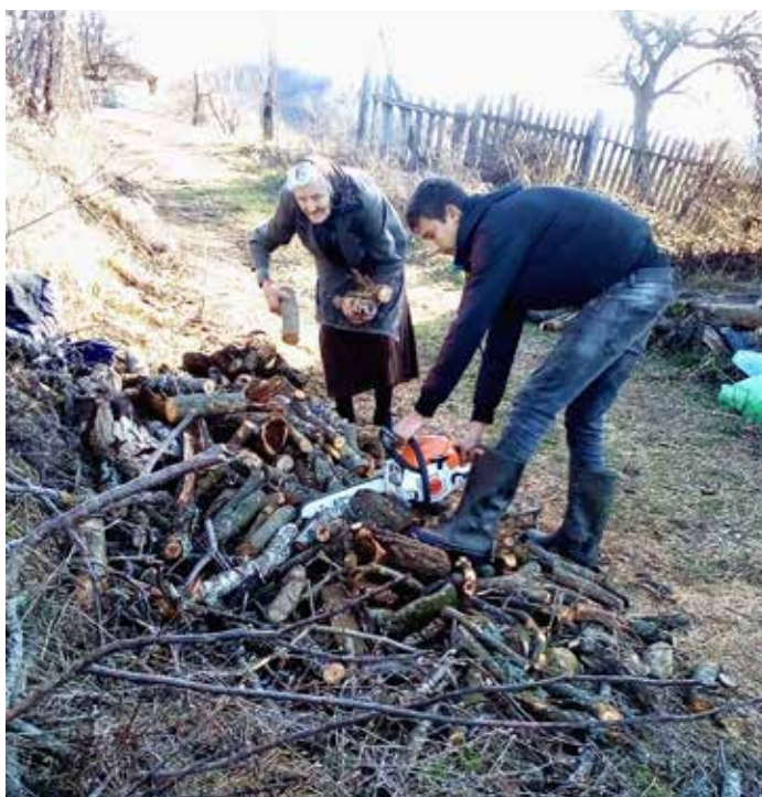
Porodica Vukičević, selo Krtok, dobili motorne testere